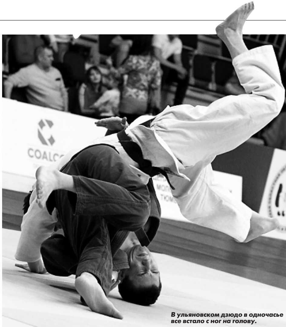
В ульяновском дзюдо в одночасье все встало с ног на голову.

На самом деле такое развитие ситуации... просматривалось и предугадывалось. В нача-