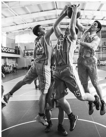
Баскетболисты Чердаклинского района защищались числом, но димитровградцы оказались сильнее умением.